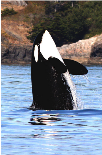
Local marine bio-acoustic source.