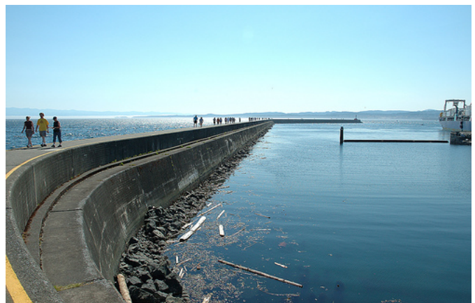
Ogden Point breakwater—a great place for a stroll.