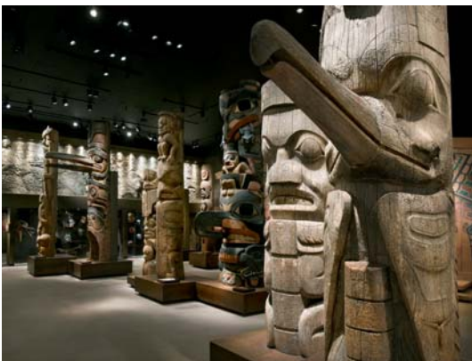
Totem Hall, Galerie des Peuples Premiers du Royal BC Museum

Inscription – Les détails sur les frais et formulaires d'inscription seront bientôt disponibles sur le site internet de la conférence. Les pré-inscriptions à prix réduits sont disponibles jusqu'au 12 septembre 2010.