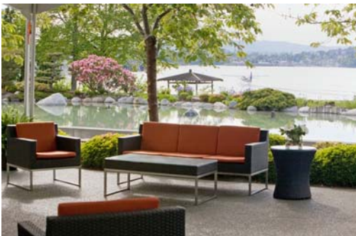
Hôtel Laurel Point et Terrasse vitrée.

Sessions Techniques – Des sessions techniques seront organisées dans tous les domaines de l'acoustique, incluant: