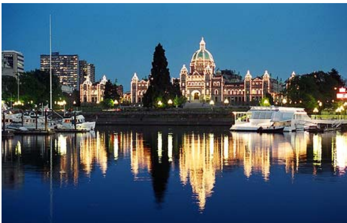
Inner Harbour and Parliament Buildings at dusk.

Keynote Talks – Plenary sessions will start each day, with keynote talks by Canadian experts on acoustics topics of wide interest including: Christine Erbe (JASCO) The Marine Soundscape , Murray Hodgson (UBC) Acoustical Environments in "Green" Buildings , and Garry Heard (DRDC-A) Canadian Defence Research in Arctic Acoustics .