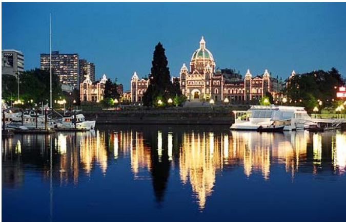
Arrière-port et Bâtiments Parlementaires au crépuscule.